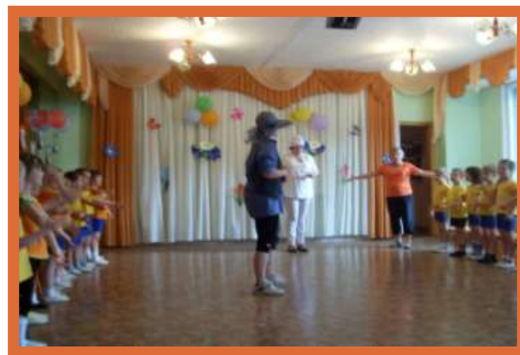
Спортивный праздник «В стране Здоровья»