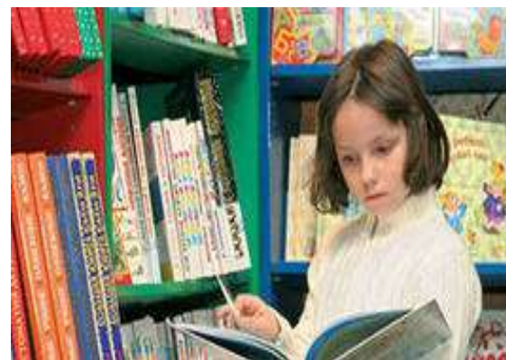
Поход в библиотеку, чтение литературы