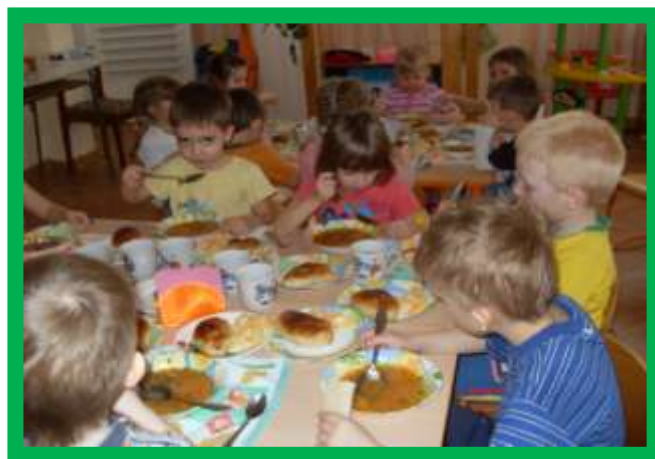
К обеду – наш лучок.