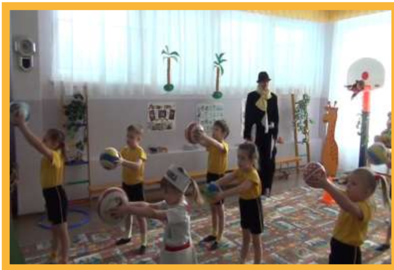
Досуг «Как мы победили Грипп»