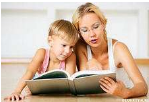
Информация от родителей.