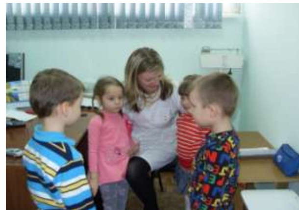
Беседа с медицинской сестрой.