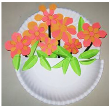
Коринка с цветами

Интересные объемные фигуры получаются из тарелки, согнутой пополам: