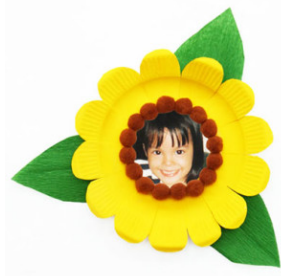
Рамка для фото

Разрезав всю тарелку по спирали и оставив овальную серединку, мы получим самую настоящую кобру. Раскрашиваем ее в подходящий цвет, приклеиваем глазки и раздвоенный язычок. Готово!